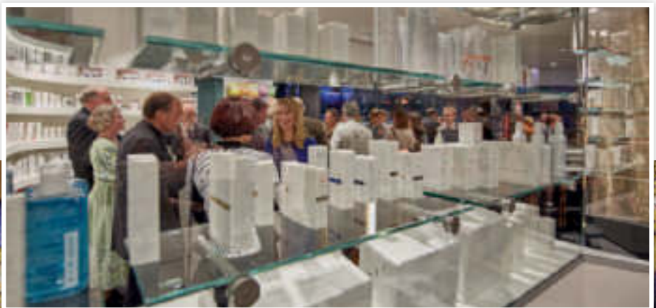
Neben Medikamenten bietet die Aesculap Apotheke auch exklusive Kosmetik-Linien